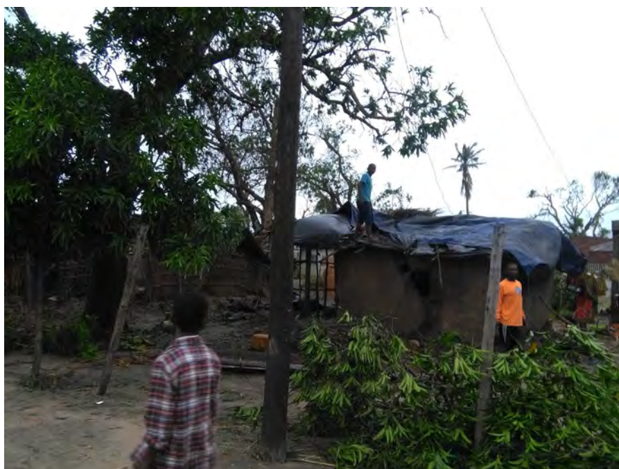
Fig 1: A população busca refazer as suas habitações