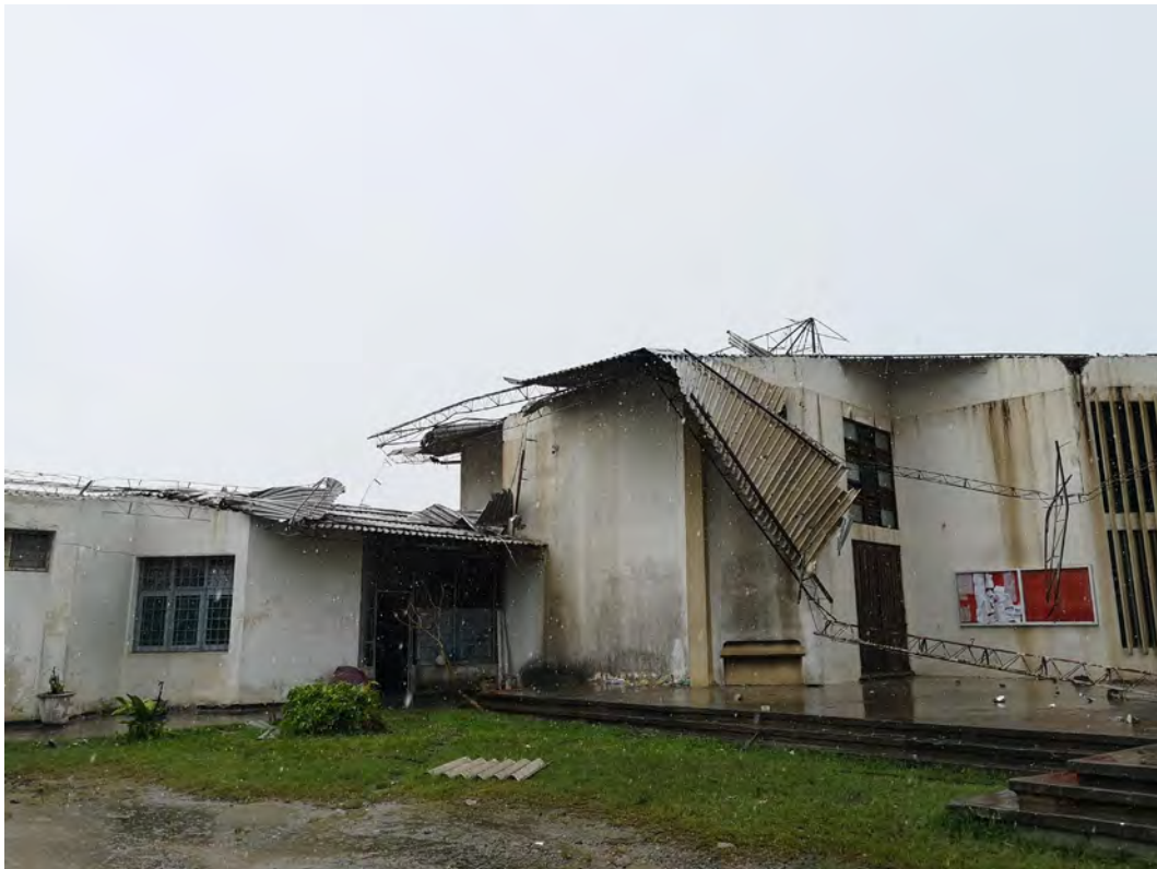
Fig 6: Igreja de Nossa Senhora de Fátima