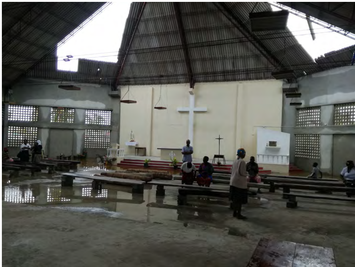
Fig 8: Paróquia da Sagrada Família