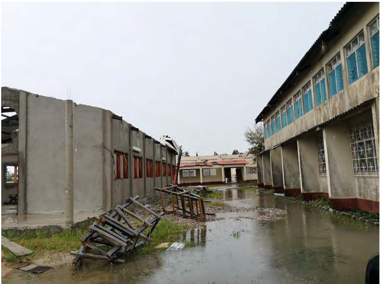
Fig 4: Seminário Bom Pastor