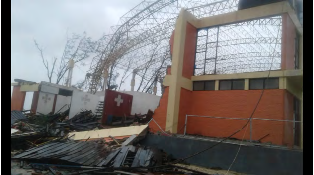
Fig 9: Paróquia do Sagrado Coração de Jesus - Macúti