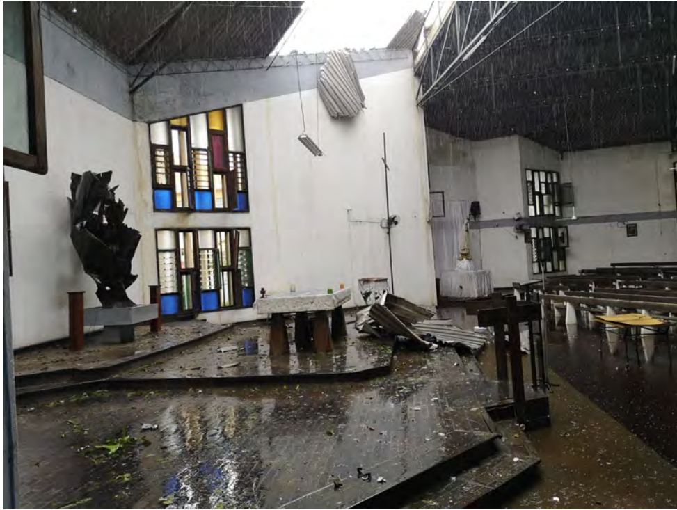
Fig 5: Igreja de Nossa Senhora de Fátima