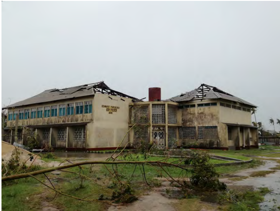
Fig 3: Seminário Bom Pastor