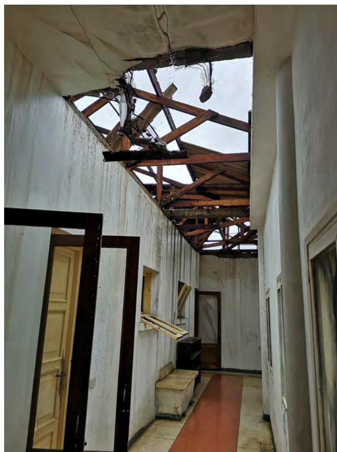
Fig 2: Corredor da Residência Episcopal