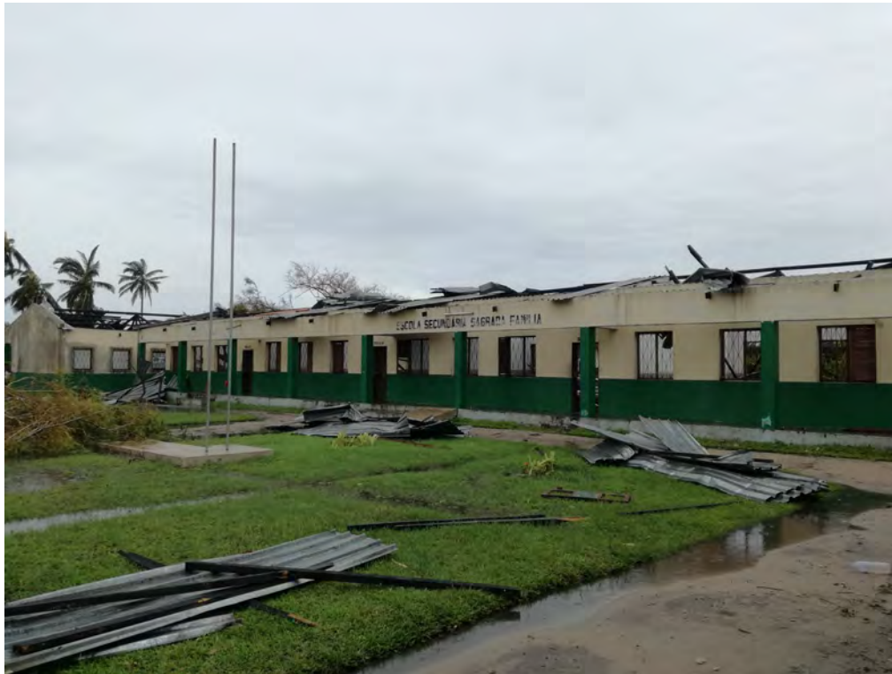
Fig 7: Escola Sagrada Família